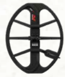
EQX 15 cívka

15 x 12" 2D cívka pro větší hloubkový dosah a pokrytí